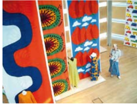
Eine norwegische Textilausstellung im Felleshuset