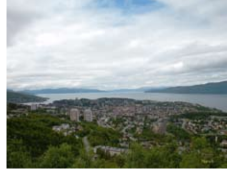
Abbildung 1: Narvik

Im umgebenden moorigen Wald kann man erste botanische Eindrücke sammeln: Heidelbeeren, Trollblumen, Orchideen und das bei uns sehr seltene Moosglöckchen ( Linnea borealis ). Nächste Station ist das Museum „Arktikum“, in dem sehr eindrucksvoll die Natur und die Volkskultur der Polarre-