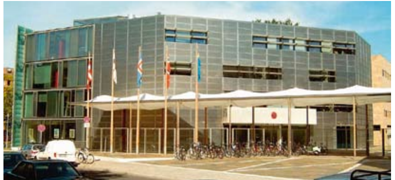
Blick auf den Eingang der Nordischen Botschaften, dahinter das Dänische Botschaftsgebäude

Ich möchte meinen Artikel, der in unserer Zeitschrift Norwegen/Österreich, Nr. 2/09 erschienen ist, durch einige Fotos, die ich anlässlich einer nordischen Textilausstellung im „Felleshus“ des Nordischen Botschaftskomplexes im Juli 2004 geknipst habe, ergänzen. Ich hatte damals den Eindruck, dass das Design der Textilien und die Architektur des Felleshuset – von dem Architektenteam Berger+Parkkinen – wunderbar mit einander harmonierten.