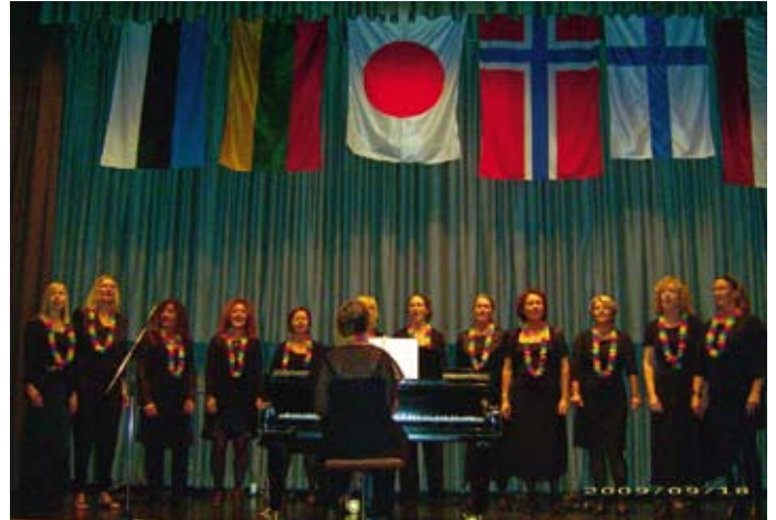
Abb. 8: Vokalgruppe „HARPERNE“