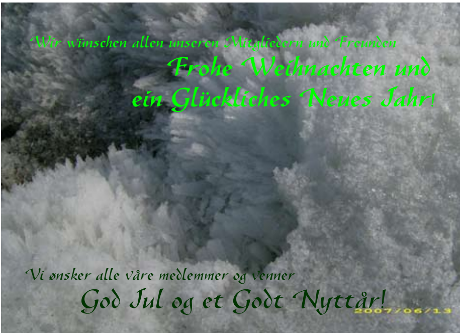
Schmelzender Schnee auf Spitzbergen