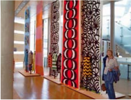
Die Textilausstellung im Felleshus, rechts der Ausgang zu den Gemeinschaftsräumen und zur Kantine im obersten Stockwerk