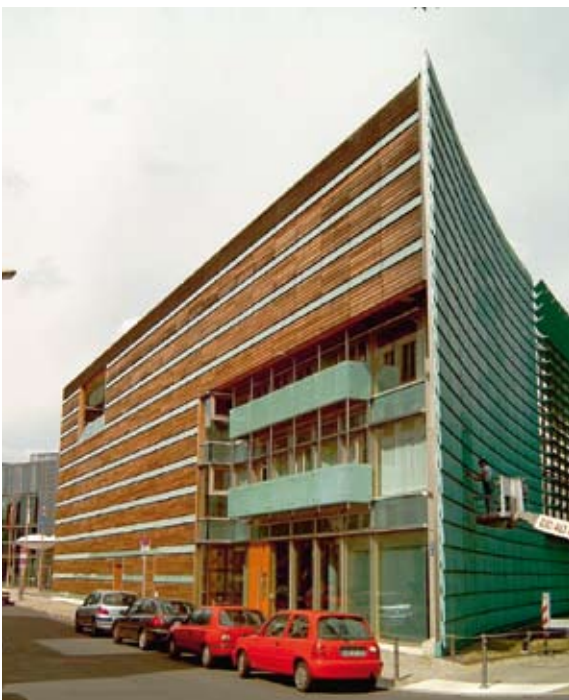
Das Felleshus, wie ein kühn geschwungener Schiffsbug von der Klingelhöferstraße aus gesehen.