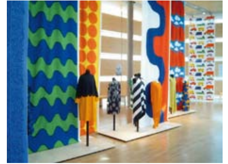
Nordische Textilien und moderne Design-Kleidung kommen hier zu wahrer Geltung