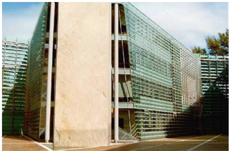
Die Norwegische Botschaft, vorne der norwegische 5 m breite Granitbolide. Die Auftraggeber waren das bekannte norwegische Architektenbüro Snøhetta