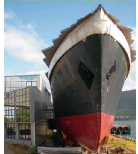
Abbildung 2: Stokmarknes

Wir passieren die Grenze nach Norwegen, und es geht hinunter nach Narvik . Die Landschaft bietet hier steile Berge und tief ins Land eingeschnittene Fjorde; der Straßenverlauf ist entsprechend verwickelt.